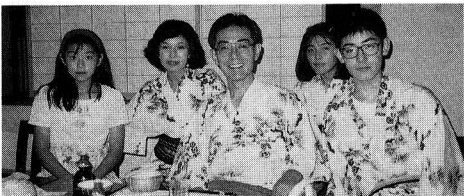
左から：伸子さん、奥様、社長、優子さん、直樹君