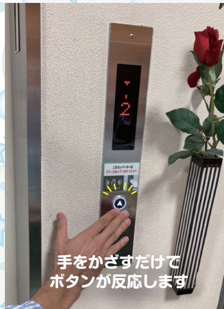
手をかざすだけで ボタンが反応します

本社エレベーターがこの度リニューアル致しました。 工事期間中は、大変ご不便をお掛けいたしました。 ご協力いただき誠にありがとうございました。