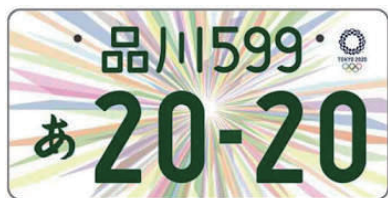
図柄入りナンバー（寄付金付き）

軽自動車にお乗りの皆さんナンバープレートを2017年4月3日より黄色ナンバープレートから特別仕様で白ナンバープレートに変更できるって知ってましたか？国土交通省が2019年ラグビーワールドカップと2020年東京オリンピックパリピックを盛り上げようと白ナンバーを交付しています。県によって登録代金は違います。右にラグビーワールドカップ、東京オリンピックピックパリピックのマークが付ききます。ほかに登録代金プラス寄付金を払うとナンバープレートにラグビーワールドカップならラグビーボールの柄が、東京オリンピックピックパリピックなら虹の光の様な柄が入ります。僕も去年、車検を受けたついでに白ナンバーに変更しました。変更するのは車購入時、車検時でなくてもいつでも変更できます。自家用車の方も特別仕様ナンバープレートにできません。この機にぜひ変更してみてくださいか。