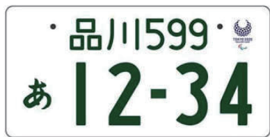
エンブレム付きナンバー（乗りもの）