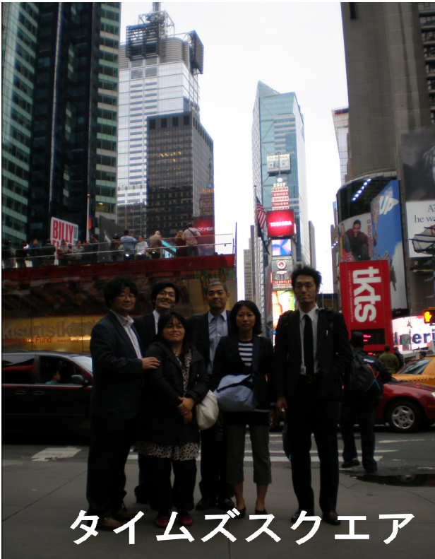
タイムズスクエア