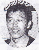
モーリン語録 「情報の共有化」

また、嘘を付く人はおしゃべりな人に多いと感じる。多分、しゃべり過ぎて自分が話をした内容を忘れてしまうのかもしれない。